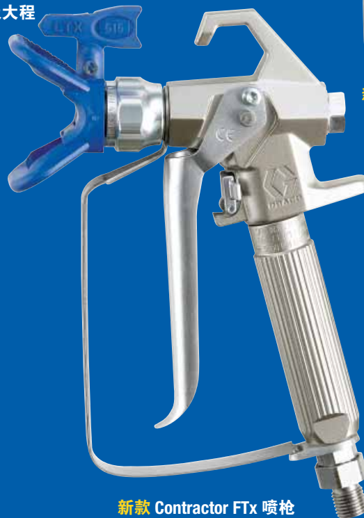
新款 Contractor FTx 喷枪