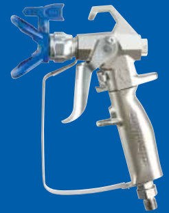
新款 Contractor 喷枪